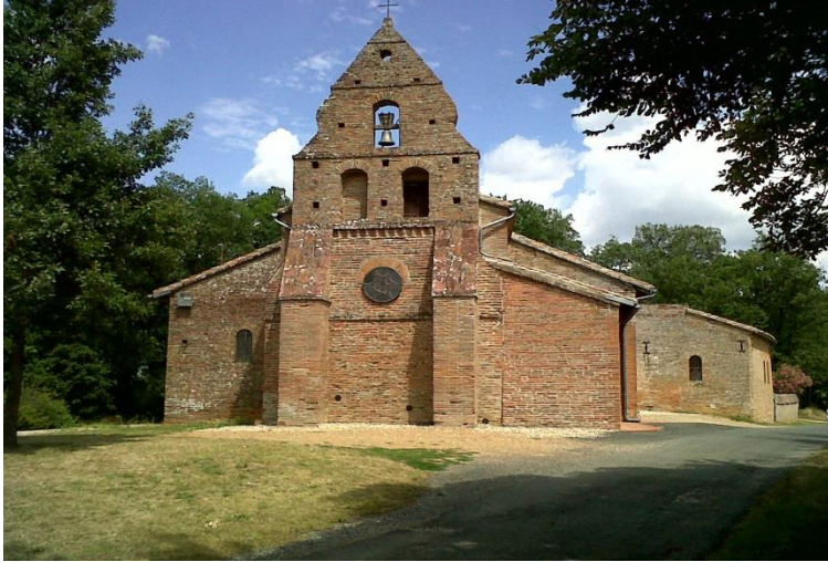
C'est dans cette chapelle que saint Vincent de Paul a célébré sa "première messe".