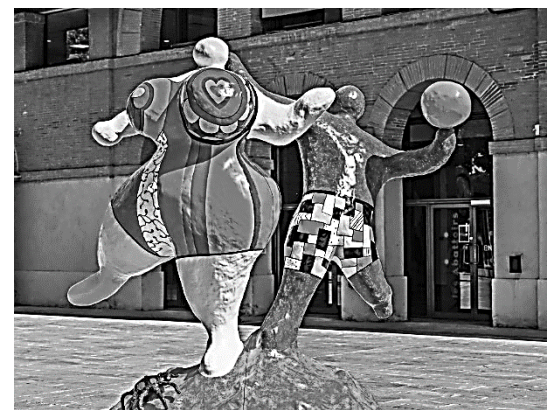
Œuvre de Nikki de Saint Phalle devant le musée des Abattoirs à Toulouse