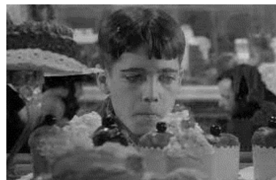
Extrait du film Inglourious Basterds (2009) de Quentin Tarantino