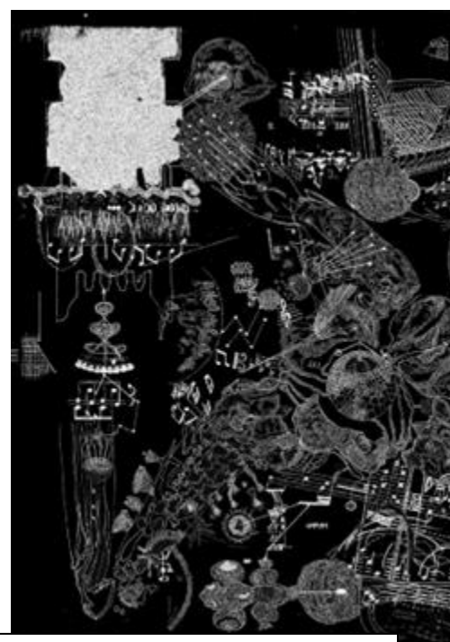
Deuxième dessin de Ki au sujet de la protéodique

séquence compose les protéines (appelées protéodiques ou musiques de protéines). Extrait du tableau du code universel de Joël Sternheimer, Alanine do (grave), Arginine do (aigu), Cystéine (la, la)... ». J'ai trouvé cet article sur un site parlant de la génodique et il m'a inspirée. Cette expérience est-elle applicable à l'être humain ? En prenant une maladie psychique ou physique, ne pourrait-on pas rejouer la séquence de la maladie (comme l'idée du vaccin) à la personne malade et imaginer que celle-ci sera guérie par sa propre information cellulaire ou musicale ? Nos cellules font de la musique et quand notre corps est malade, elle devient dissonante. Rejouer la partition « saine » aurait certainement un impact positif sur nos corps. Ki.