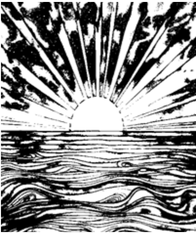
Illustration trouvée sur internet et que l'auteur trouvait appropriée.

Quand ma fille est née, je suis tombé en amour. Nous sommes en 2002. Je travaillais dans le commerce six mois en Italie, six mois au Maroc. Au fil des ans, en rentrant du travail, j'ai remarqué que ma fille ne semblait pas au mieux. A l'âge de cinq ans, elle a commencé à avoir de l'asthme. Ma tête était accaparée par cela. Je craignais que ma femme ne soit violente envers elle. Je sentais aussi que ses frères (dont elle est très proche) intervenaient beaucoup auprès d'elle. Je ne sortais plus et je me sentais enfermé avec eux. Cette période est compliquée pour moi car je voyais ma fille aller de moins en