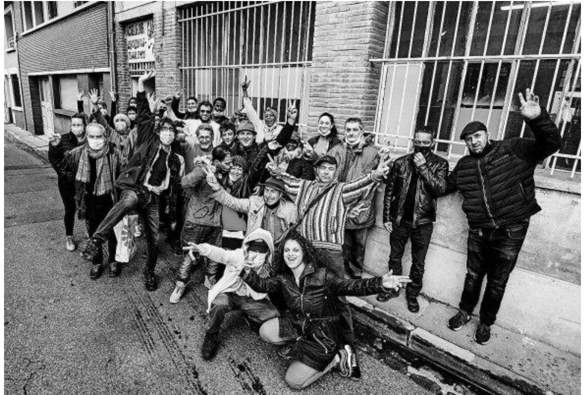
Les membres de l'accueil de jour du Gaf situé au 13 rue du Professeur Janmes en 2018

Riche d'histoires, d'humour et de réflexions, ce journal a pour but de laisser la parole à celles et ceux qui ne l'ont que trop rarement. Coups de gueule, coups de cœur, nous avons tous et toutes dans le ventre des pensées qui ne demandent qu'à s'exprimer. En arabe, en espagnol, en français voire en mandarin, qu'importe le flacon pourvu qu'on ait la presse !