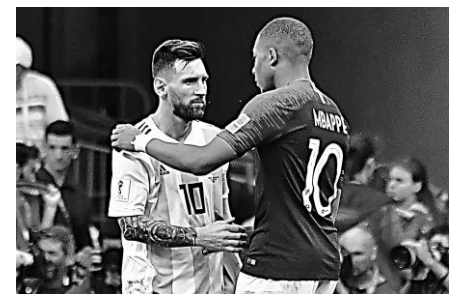
Kylian Mbappé et Lionel Messi après la finale de coupe du monde 2022