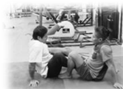
Deux lutteurs qui s'entraînent

Toutes les personnes qui le souhaitent ! Les hommes comme les femmes. Il suffit d'en avoir l'envie. Aucune expérience n'est nécessaire. La salle est ouverte le lundi, mardi, mercredi, vendredi de 10h à 16h.