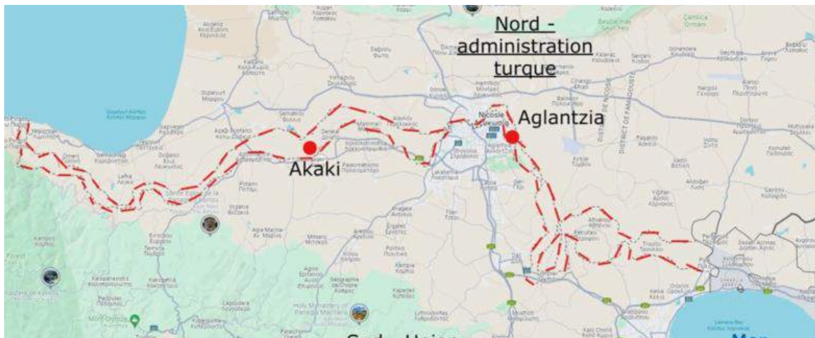
Figure 1 Figure 1 La zone tampon de l'ONU sépare l'île de Chypre en deux.

Bien que le HCR "reconnaisse les défis auxquels Chypre est confrontée en ce qui concerne les nouveaux arrivants", l'agence s'inquiète néanmoins "des mesures qui indiquent une tendance inquiétante au rétrécissement de la protection à Chypre". Parmi elles, la suspension, décidée mi-avril 2024, du traitement des ressortissants syriens. Une