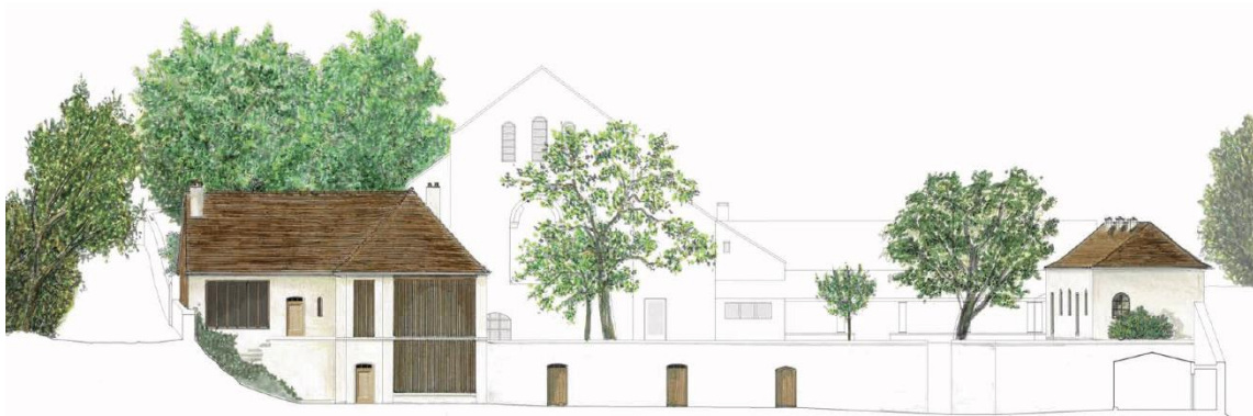
Plan de la future Porterie (façades nord) ©ATAU

Accompagnés par un Architecte des Bâtiments de France, nous avons veillé à concevoir un bâtiment esthétique, qui puisse s'intégrer parfaitement dans le paysage vézelien et le cadre patrimonial de La Cordelle, dont la chapelle est classée « monument historique ».