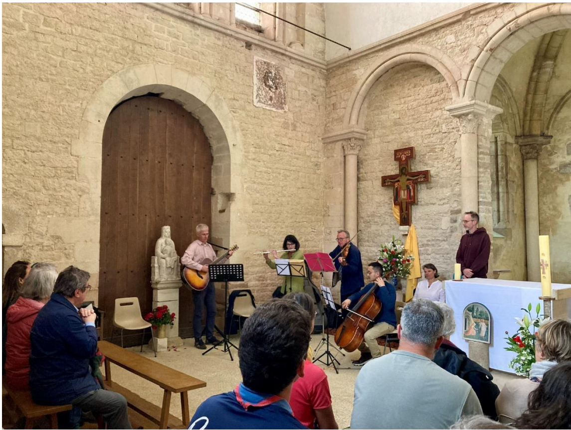
Concert autour du Cantique des Créatures à la chapelle de La Cordelle (mai 2025)